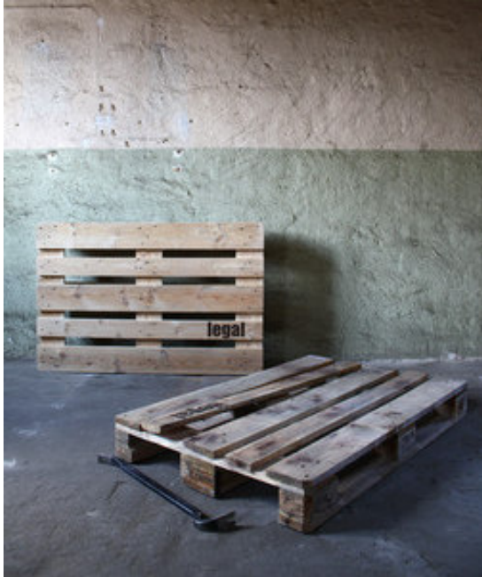
Robert Kunec, Europa-L, 2 Europaletten, Brecheisen, Schriftzug, 2009

- ein (un-)möglicher Weg nach Europa. Kunec skizziert mit "Europa-L" seine unbequemen Wahrheiten intuitiv und mit konzeptueller Leichtigkeit.