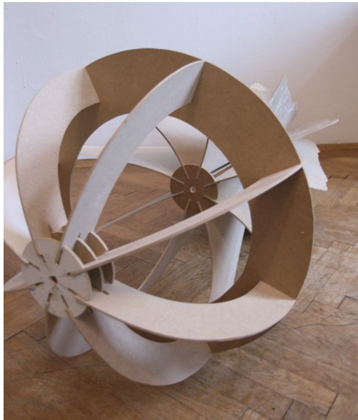
o. T., 45 x 45 x 110 cm, 2009, HDF und Lack