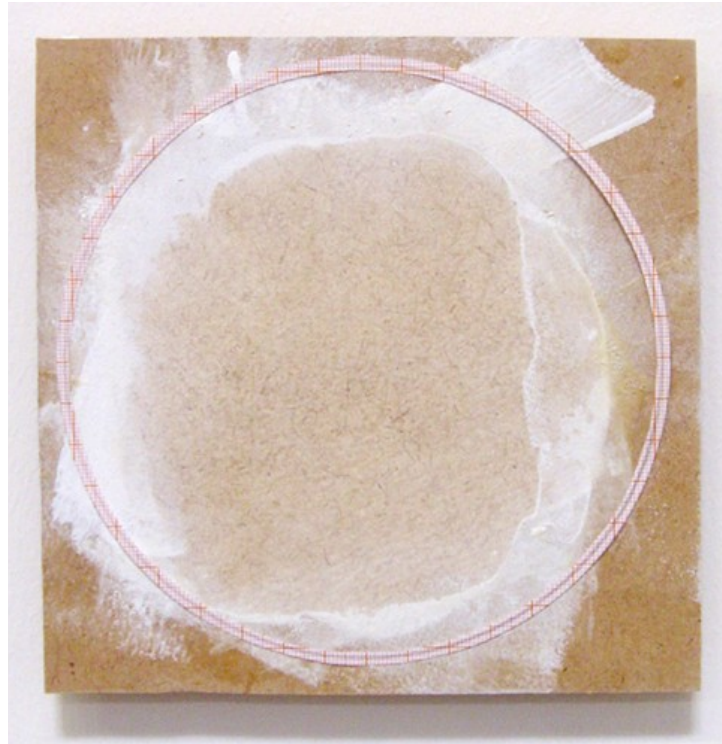
Circle Surface Sun II, 2009, Mischtechnik auf HDF